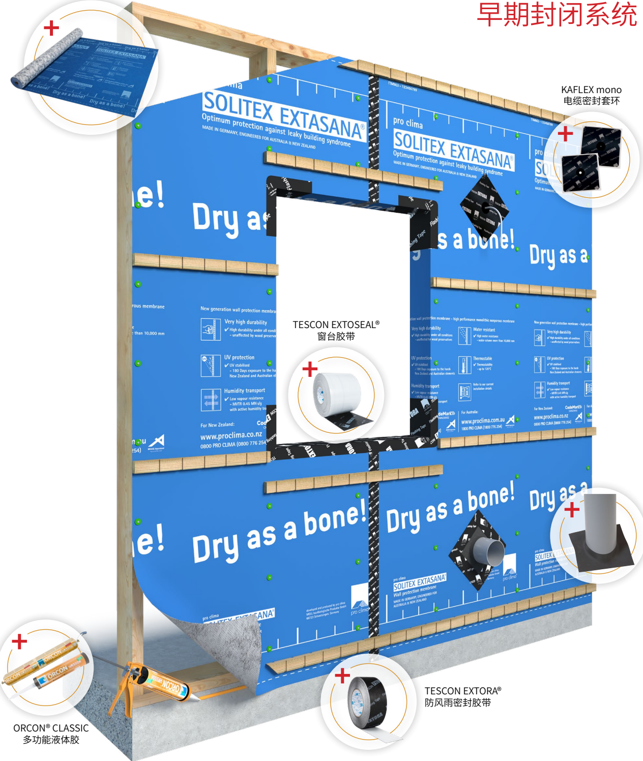
TESCON EXTORA® 防风雨密封胶带