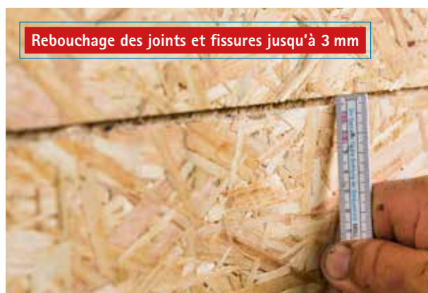
Rebouchage des joints et fissures jusqu'à 3 mm

L'enduit d'étanchéité AEROSANA VISCONN FIBRE, armé de fibres, permet de réaliser facilement et rapidement l'étanchéité à l'air de fissures relativement larges, aussi bien par application au pinceau qu'au pulvérisateur (AEROFIXX).