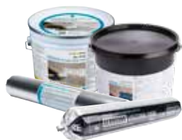
AEROSANA VISCONN FIBRE/white Enduit d'étanchéité pulvérisable, armé de fibres, avec valeur s_d hygrovariable bleu/noir ou blanc, (AEROSANA VISCONN FIBRE: résistant au gel et à l'humidité)