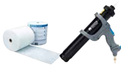
AEROSANA FLEECE Non-tissé destiné au recouvrement de fissures et fentes