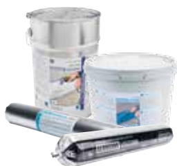
AEROSANA VISCONN /white Enduit d'étanchéité pulvérisable avec valeur s_d hygrovariable bleu/noir ou blanc, (AEROSANA VISCONN bleu/noir: résistant au gel et à l'humidité)

AEROSANA VISCONN / white: 10 l seau, 0,6 l sachet tubulaire; AEROSANA VISCONN FIBRE / white: 5 l seau, 0,6 l sachet tubulaire AEROSANA FLEECE: 25 m x 150 mm; AEROFIXX: 1 carton