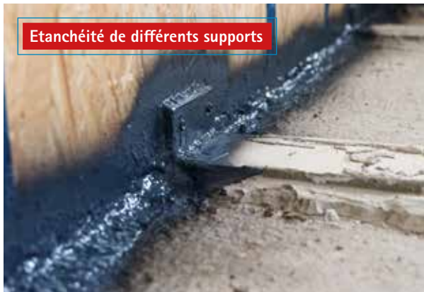
Étanchéité de différents supports

Réalisation de l'étanchéité à l'air de maçonneries apparentes