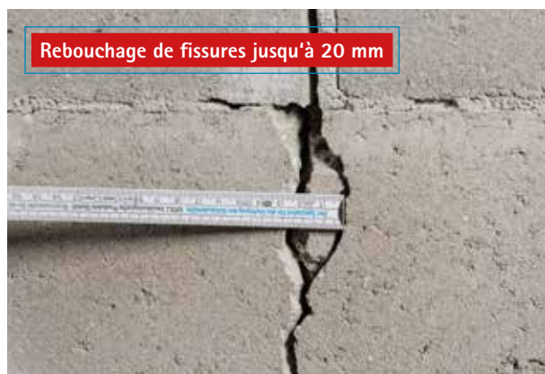
Rebouchage de fissures jusqu'à 20 mm

Pour la consolidation des supports lors d'une rénovation de toiture par l'extérieur