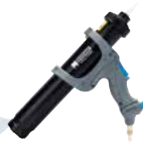
AEROFIXX Applicateur pour sachet tubulaire du système AEROSANA