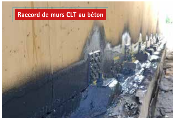
Raccord de murs CLT au béton

Passage étanche à l'air entre des éléments CLT et des dalles béton par exemple, y compris dans des configurations géométriques complexes (par exemple équerres). Pour cela, le CLT (ou au moins la couche en liaison avec la pulvérisation) doit être étanche à l'air. Les mortiers gonflants peuvent y être simplement intégrés.