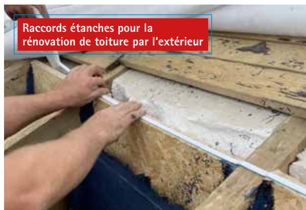
Raccords étanches pour la rénovation de toiture par l'extérieur