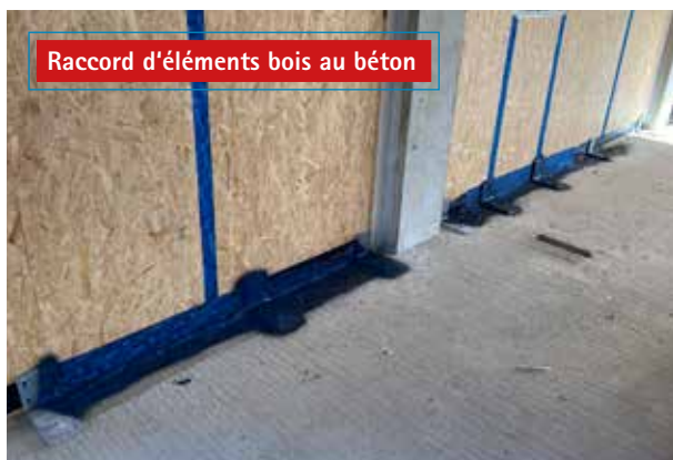
Raccord d'éléments bois au béton

Raccord économique et étanche à l'air d'élément en bois aux éléments de construction adjacents.