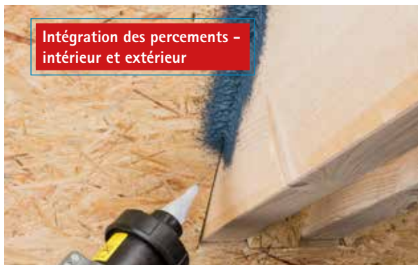
Intégration des percements - intérieur et extérieur

Intégration étanche à l'air facile de percements (par exemple de faux-entrants ou de chevrons lors de la rénovation d'un toit par l'extérieur).