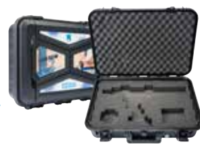
AEROBOX Coffret de transport pour AEROFIXX avec garniture flexible