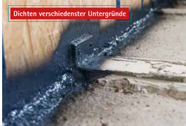
Dichten verschiedenster Untergründe

Die Flüssigfolie haftet auf allen bauüblichen Materialien.