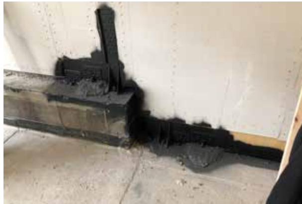
Durchdringungen einbinden innen und aussen

Wirtschaftlicher, luftdichter Anschluss von Holzelementen an die angrenzenden Bauteile.