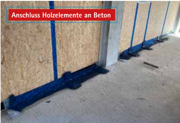
Anschluss Holzelemente an Beton

Wirtschaftlicher, luftdichter Anschluss von Holzelementen an die angrenzenden Bauteile.