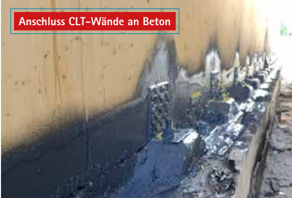
Anschluss CLT-Wände an Beton

Luftdichter Übergang von CLT-Elementen auf z. B. Betonplatten inkl. schwieriger Geometrien (z. B. Winkel). Die Deckschicht der Elemente muss dazu luftdicht sein. Quellschichten können einfach eingebunden werden.