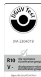
SOLITEX ADHERO VISTO