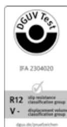
SOLITEX ADHERO 1000