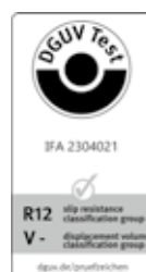
SOLITEX ADHERO 3000