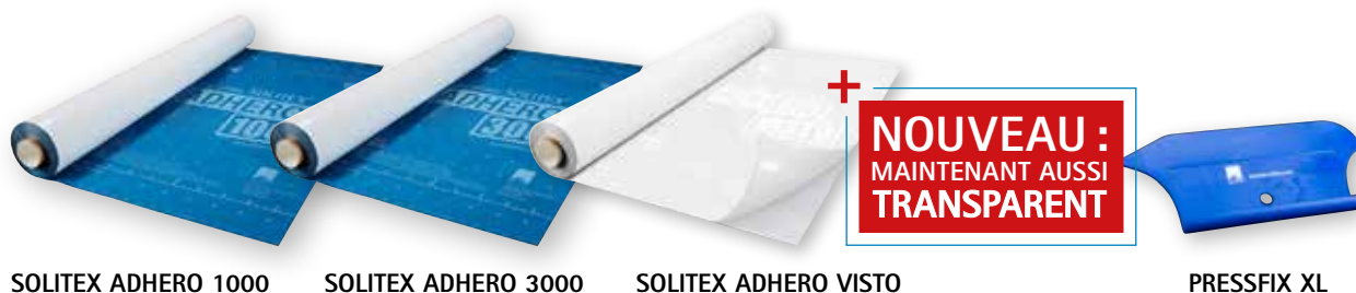
SOLITEX ADHERO 1000

Longueur : 30 m ; Largeurs : 0,5 m, 1,00 m, 1,50 m (0,3 m que pour le SOLITEX ADHERO VISTO)